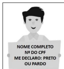
Figura 3. Modelo de Autodeclaração