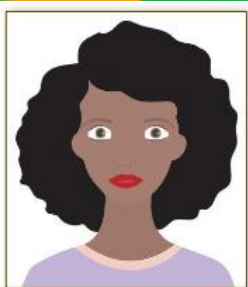
Figura 1. Modelo de Foto Frontal