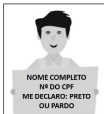
Figura 3. Modelo de Autodeclaração